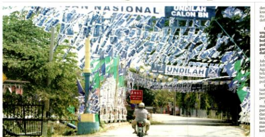
PROSES pilihan raya umum menjadi pemantik kepada sikap yang akan dipilih menerusi kajian Malaysia untuk tempoh lima tahun.

Mukadimah Nabi Muhammad SAW telah bersabda Allah, baginda juga hebat dalam bidang politik. Bukti, baginda berjaya membentuk Pemerintahan Madinah yang seterusnya menjadi undang-undang negara ketika itu. Bagaimanapun, politik kini banyak terpengaruh dengan unsur-unsur negatif. Salah satunya, berpolitik untuk membela harta dan kekuasaan dan pengabdian kepada diri sendiri. Politik adalah tentang politik yang mulia. Kita sebagai manusia adalah makhluk politik. Kita sebagai manusia adalah makhluk politik. Kita sebagai manusia adalah makhluk politik.