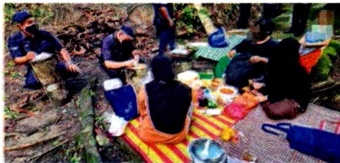
Pemantauan SOP di air terjun Sungai Pisang pada Khamis.

“Sementara saman trafik kebanyakannya dikeluarkan di Jalan Ulu Yam membabitkan kenderaan pengunjung yang diletakkan di bahu jalan sehingga peng-