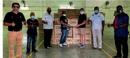
At the handing over are representatives and recipients of the Mitsubandi Care Pak and essential packs.

On helping their own internal staff, the developer said the entire team had started preparing to transition weeks ahead of the last full movement control order (MCO). "We are glad that we have been able to work efficiently with all the tools required for employees to work from home without much challenge," he added.