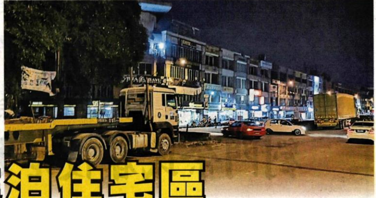
■由于“巨无霸”停泊在路口，遮挡视线，造成驾车人士的视觉盲角。