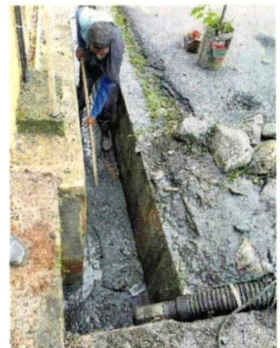
■沟渠的沙泥累积多时, 清洁工人必须费力挖掘, 才能成功清除沟渠内“顽固”的泥土。

“若其他地区面对类似问题, 可与我们联系, 以便我们善用与市议会、达鲁益山集团 (KDEB) 废料管理公司互联网与平台, 协助居民解决民生问题。”