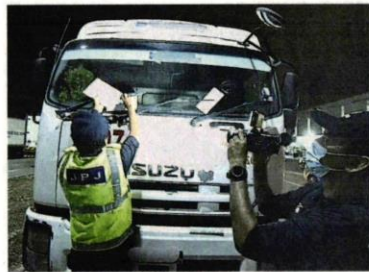
■执法人员发出罚单，给其中一辆违例泊车的罗厘。