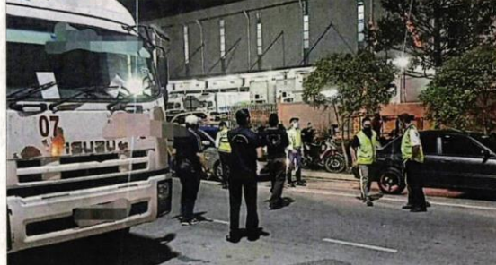
■市议会一再展开取締行动，今年已开出1302张罚单。

他说，市议会非常关注“巨无霸”违例所带来的民生破坏和安全问题，因此会持续展开执法行动，希望司机们守法，停止继续对社区带来危害。