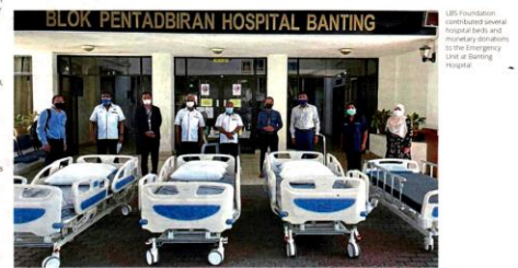
LBS Foundation distributed several hospital beds and monetary donations to the Emergency Unit at Banting Hospital.

"The continued acts of kindness of such developers are helping to restore humanity's hopes in times of despair. And by adding more moral elevation to our lives, we may even be moved to become the next heroes in a mobility safe yet to be written."