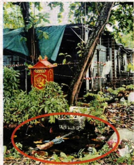
↑班村萬津路的這條土溝難以流通，乍看下就如一條長長的“水池”。