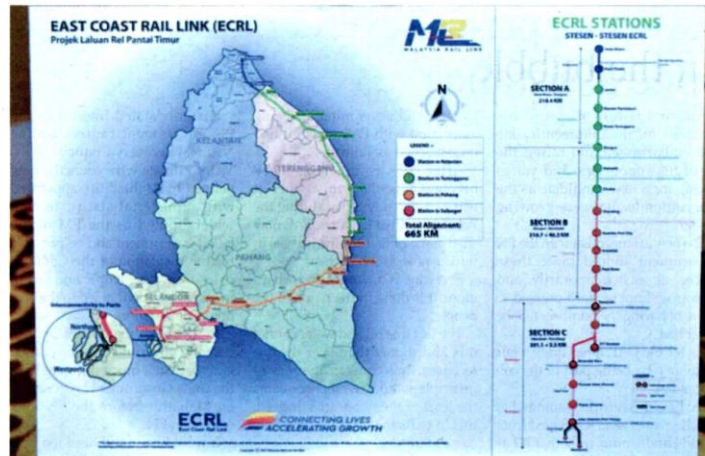
Through detailed planning, the operations of the ECRL in the southern area will bring economy to the people and a sustainable development for Selangor

"Similar preparations are also being made by other local councils to facilitate the construction of the ECRL through the southern alignment," he said in a statement recently.