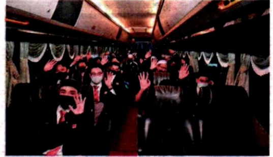
Penuntut menaiki bas dari Lobi Utama BSIS ke KLIA pada Rabu.

Sebanyak dua bas membawa penuntut terbabit diiringi oleh anggota polis ke KLIA.